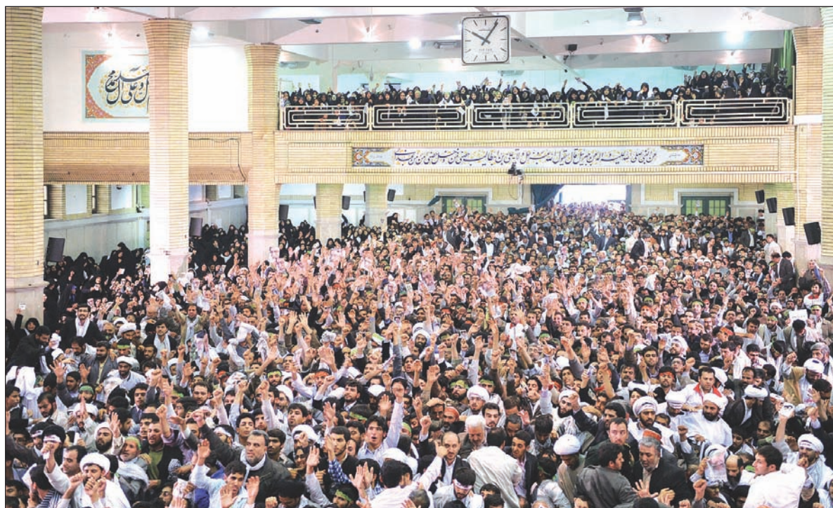
در دیدار پرشور هزاران نفر از مردم اصفهان با مقام معظم رهبری طنین انداز شد: