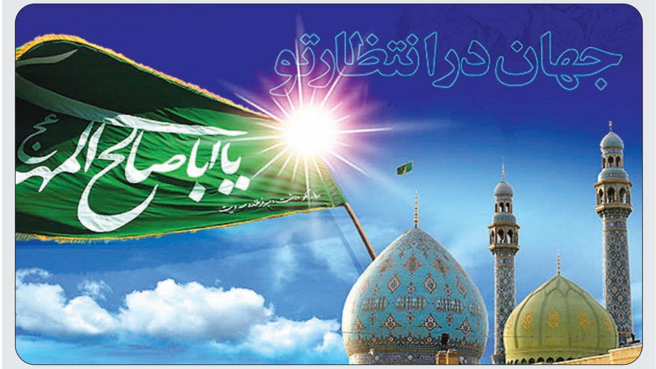
اصفهان، شهر عاشقان اهل بیت مصطفی (ص) بار دیگر خود را به عشق روی بقیة الله الاعظم (عج) آذین کرد:

جستاری در خصوص بازی‌های رایانه‌ای: بازی؛ بستری برای انتقال فرهنگ