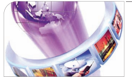
اصفهان زیبا بررسی می‌کند:

همه به وظیفه خود در زمینه عادی‌سازی پسماندهای بیمارستانی عمل کنند