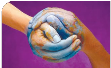
ویژه نامه شهرزندی

گفتگو با رویس دانشکده علوم اداری و اقتصادی دانشگاه اصفهان شهروندانی تاثیرگذار در جهان امروز باشیم