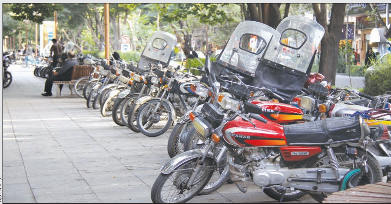
کسب وکار خیرین