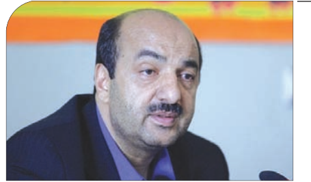
نایب رئیس شورای اسلامی شهر اصفهان: اجرای پروژه بهشت آباد همت ویژه همه مسولان استان را می طلبد