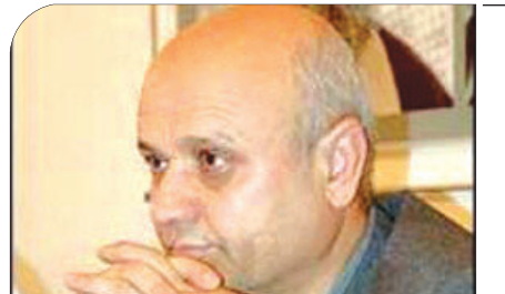
بررسی حجاب و عفاف در گفت‌وگو با دکتر اقلیما الگو که نباشد از غرب تقلید می‌کنیم