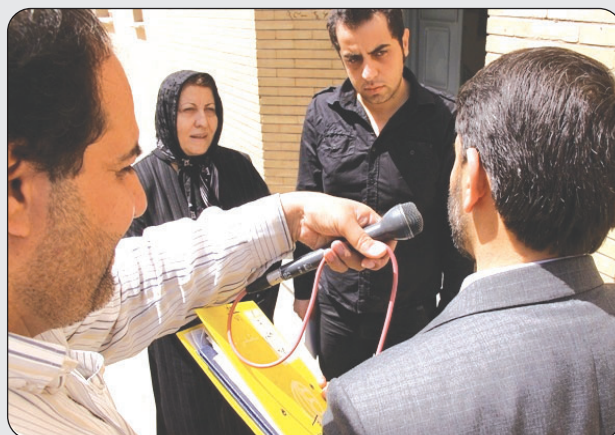
قبل از خبر: شهردار منطقه به پسر و همسر مالک خانه می گوید: اگر ممکن است سند مالکیت خانه خود را نشان دهید تا خبری به شما بدهم