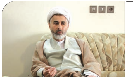
گفت‌وگو با دکتر منصور لقای سازمان امنیت ملی استرالیا، مرا ریسک می‌دانست

به مناسبت هفته مالیات با حضور صاحب‌نظران و مسولان اقتصادی، اصفهان زیبا بررسی می‌کند: