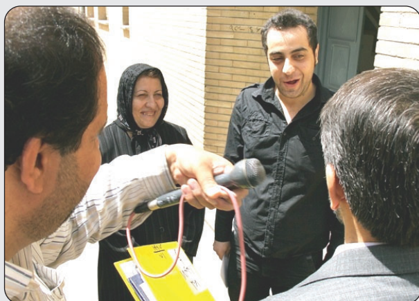
بعد از خبر: شهردار می گوید: شما برنده یک دستگاه آپارتمان به ارزش یک میلیارد ریال شده اید و خوشحالی مادر و فرزند خانواده از شنیدن این خبر ...