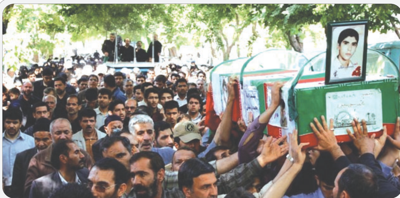
همزمان با سالروز شهادت حضرت صدیقه طاهره (س):