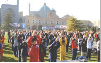
فرهنگ و هنر

به منظور ایجاد نشاط در فضای شهر و ارتقای سلامت شهروندان ۱۵۰ سری تجهیزات حرکت درمانی در پارک‌ها نصب شده است