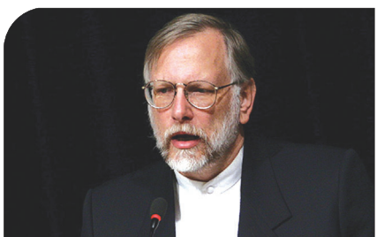
ویژه نامه فرهنگ و اندیشه

فرمانده انتظامی استان اصفهان در جمع خبرنگاران خبر داد: امنیت و آرامش در ایام عید نوروز با حضور ۱۲ هزار نیروی پلیس