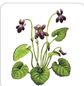
بنفشه ی عطری