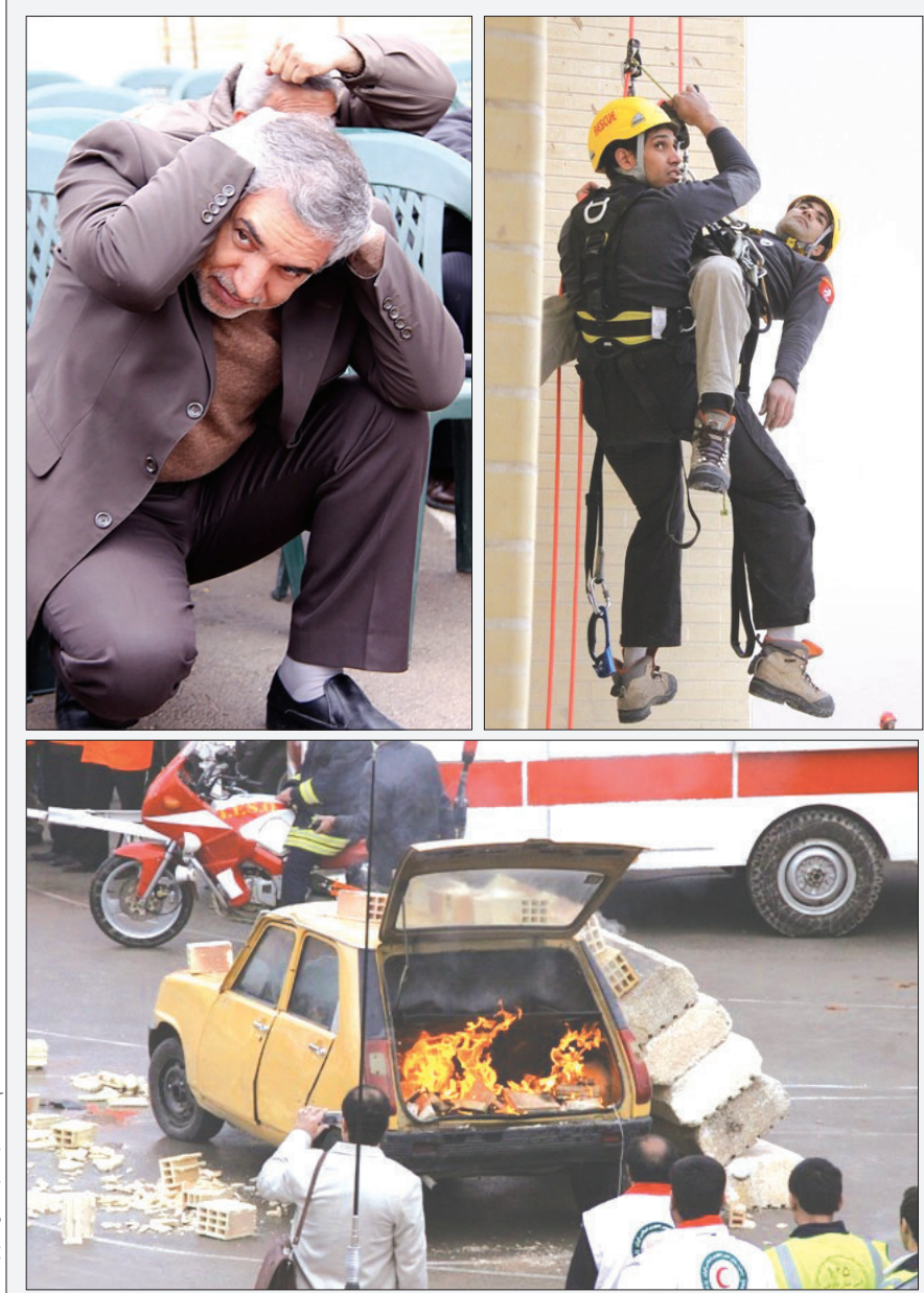
روزگارشهرزندی: هم‌رسانه‌های شهرزندی، هم‌رسانه‌های شهرزندی، هم‌رسانه‌های شهرزندی

سد معبر، مشکل همیشگی شهر قارقارک هایی که سد معبر می‌کنند