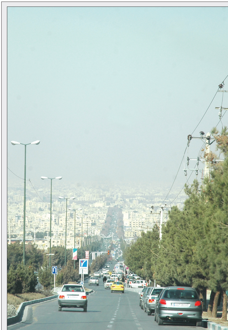
مسوول آزمایشگاه‌های هوای محیط زیست استان: