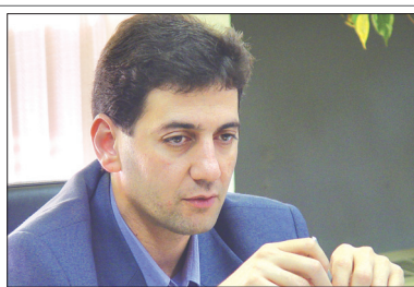
دکتر قاری قرآن معاون عمرانی شهرداری اصفهان: