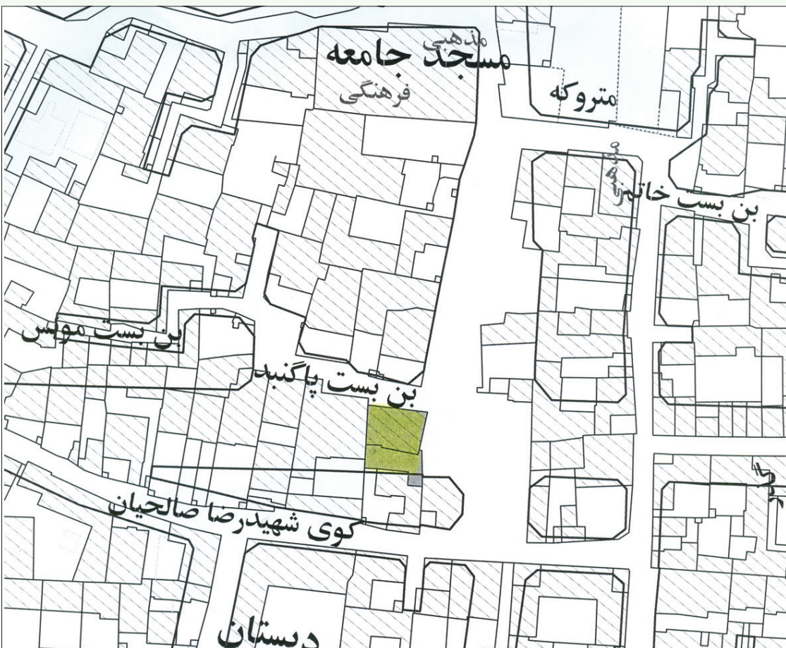
شهرداری منطقه سیزده اصفهان