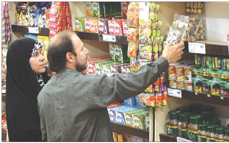
نتیجه مطلوب گرفته نشد.

بصیرت بهترین راهکار را چاره‌اندیشی و دور هم نشستند همه دست‌اندرکاران بازار دانست و گفت: در چنین نشستی متولیان هر بخش وظایف و عملکردهایش را مطرح می‌کنند و اگر گروهی حضور کرده باشند مجبور به پاسخگویی می‌شوند. همه چیز داریم بازار متعادل می‌شود متولی اصناف اصفهان از رسانه‌ها برای فرهنگ‌سازی و روشن کردن ذهن جامعه کمک خواست و گفت: گرانی کالاها نباید مصرف‌کنندگان را به گمان کمبود بیندازد و باعث نگرانی آنها شود مردم مطمئن باشند همه چیز در استان اصفهان داریم و بازار هم به زودی متعادل می‌شود. همچنین رییس مجمع امور صنفی بازگشت به شرایط عادی را برای بازار پیش‌بینی و به مصرف‌کنندگان توصیه کرد تا آن وقت برای خرید منتظر بمانند و به جو روانی کاذبی که ایجاد شده توجه نکنند. وی با اشاره به لزوم جلوگیری از رشد بی‌رویه قیمت‌ها گفت: برای هر کالایی که به بازار مصرف می‌آید دو مقوله قابل بررسی و کنترل است گرانی و گران‌فروشی. گران‌فروشی هم معضل است بصیرت با این باور که اصناف در گرانی و تعیین قیمت‌نقشی ندارند گفت: برای ما گران‌فروشی معضل است به همین دلیل به سرعت و شدت با این تخلف برخورد می‌کنیم.