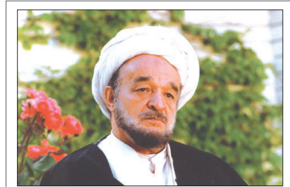
یادنامه استاد علامه محمدتقی جعفری: