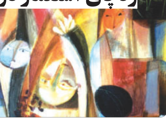
گروه تاریخ و اندیشه:

استعمار یا استعمارگری، در لغت به معنای «آبادانی خواستن» و «آباد کردن» که مقصود از آن، مهاجرت گروهی از یک کشور و تشکیل یک ماندگانه تاز در سرزمینی نو یافته، و آباد کردن آن است. اما معنای دیگری آن، که امروزه به کار می رود، تسلط ملتی قدرتمند بر یک قوم با ملت ضعیف است.