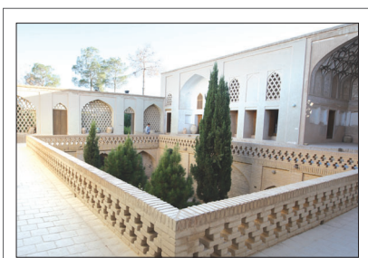
بازدید اعضای تحریریه روزنامه اصفهان زیبا از خانه‌ای در دل کویر

مدیر کل هما در اصفهان اعلام کرد کمبود ۱۵۰۰ صندلی در ناوگان هوایی استان برطرف می‌شود گروه خبر: با اضافه شدن هزار و ۵۰۰ صندلی به ظرفیت پروازهای داخلی استان، مدیر کل هما در اصفهان اطمینان داد کمبود ناوگان هوایی در مرکز کشور برطرف می‌شود. محمد سادات قلمزن با اشاره به انجام ۷۵ پرواز در هفته از اصفهان گفت: این پروازها بین ۱۳ نقطه داخلی و دو نقطه خارج از کشور صورت می‌گیرد. ۱۱ صفحه