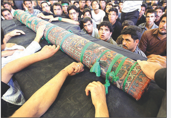
کالیشویان یکی از کهن‌ترین آیینهای سنتی مذهبی ایران است که همه ساله در دومین جمعه مهرماه برای بزرگداشت شهید اردهال حضرت سلطان علی بن امام محمد باقر(ع) در خطه گلگون اردهال برگزار می‌شود. مشهد اردهال در ۴۵ کیلومتری جنوب غربی کاشان واقع است.