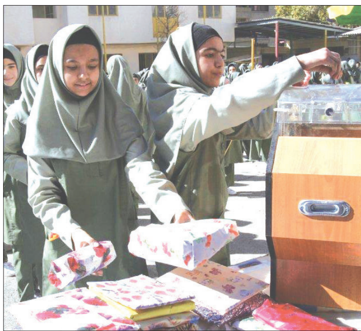
جشن عاطفه‌ها در اصفهان صحنه ماندگار ایثار و صمیمیت شد