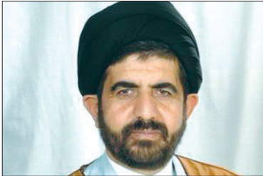
عضو کمیسیون اقتصادی مجلس شورای اسلامی

وی در پایان اعلام نمود که یارانه نقدی به پنج دهک جامعه تعلق خواهد گرفت.