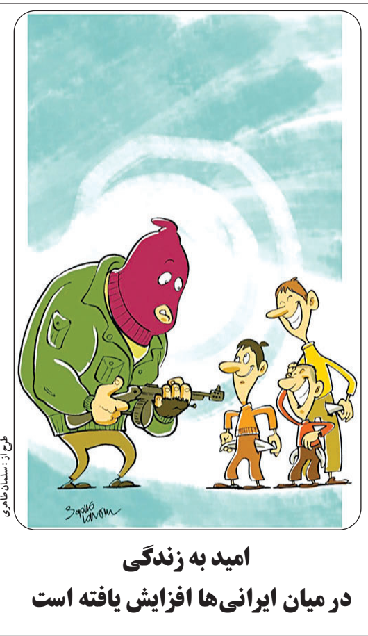
امید به زندگی در میان ایرانی ها افزایش یافته است

خیلی نرم و راحت بنشینند. خانم ها به دنبال میل های ظریف تر، با قوس و انحنا لطیف تر، و کوسن های تزئینی زیاد هستند. آقایون ترجیح می دهند اتاق را با رنگ های تیره، خاکی، و قهوه ای اشباع کنند. خانم ها بیشتر طرفدار رنگ های شاد و روشن هستند و تجلی رنگ های ملایم تر را ستایش می کنند. خانم ها به جزئیات اهمیت می دهند و آقایون فقط به کلیات فکر می کنند. با وجود این همه تفاوت زوج ها چگونه می توانند خانه خود را به نحوی بچینند که هر دو از آن راضی بوده و لذت ببرند؟ در اکثر موارد خانم ها به نظر آقایون اهمیت نمی دهند و خانه را مطابق با سلیقه خود می چینند؛ در این مقاله چند راهکار به شما پیشنهاد می کنیم که به واسطه آن راحت تر با همسر خود کنار بیایید. خانم ها باید در چند منطقه به آقایون اجازه مانور بدهند. به عنوان مثال چیدمان انباری و گاراژ را به آنها بسپارید تا هر چقدر که می خواهند مشغول شوند. قسمت کباب پزی هم یکی از بخش های مورد علاقه آنهاست. آقایون اغلب اوقات ترجیح می دهند که روی یک میل بزرگ با رنگ تیره، جنس چرمی و