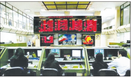
مدیربورس منطقه اصفهان با اعضای هیات مدیره

وی اظهار داشت: سهام داد و ستد شده در مبادلات این هفته بورس اصفهان متعلق به ۱۷۳ شرکت بود در این مدت ارزش سهام ۱۰۴ شرکت افزایش، سهام ۶۲ شرکت کاهش و سهام هفت شرکت حاضر در بورس بدون تغییر باقی ماند. وی سهام اصفهان در مبادلات این هفته بورس کشور را ۷/۲ درصد و سهم خرید از مبادلات بورس اصفهان را ۴۶/۵ درصد اعلام کرد.