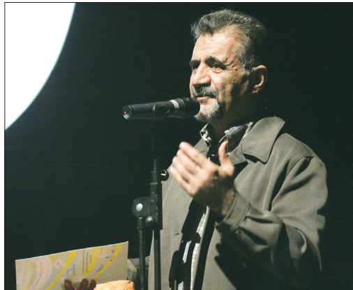
شاعر شعرهای کودکان را همه خوب می‌شناسند. در لابه‌لای برگیه‌های کتاب‌های درسی نچوهای به تحریر آمده‌اش ذهن کودکان را نوازش

جالب اینکه او با لحنی که مطابق با روحیات کودکان و نوجوانان حاضر بود درس‌های بزرگی را در زمینه شعر و ادب به آنها داد. به چند دانش‌آموز هم فرصت داد تا اشعارشان را در این برنامه بخوانند و در این رابطه راهنمایی شوند و در ضمن همه را به کتابخوانی سفارش کرد. ما از رحماندوست پرسیدیم با توجه به اینکه چند سالی است شعر می‌سراید و چند نسل از اشعار او لذت برده‌اند چگونه این تفاوت فکر در نسل‌ها را در شعرهایش اعمال می‌کند. او می‌گوید به حتم من هم به تفاوت اندیشه کودکان امروز و دیروز توجه دارم پس باید شعرهایی که روز شود و برگزیده خواننده نمی‌شود. این جلسه با خواندن دو شعر جدید از رحماندوست و آرایه دست خطی به کودکان مشتاق به پایان رسید.