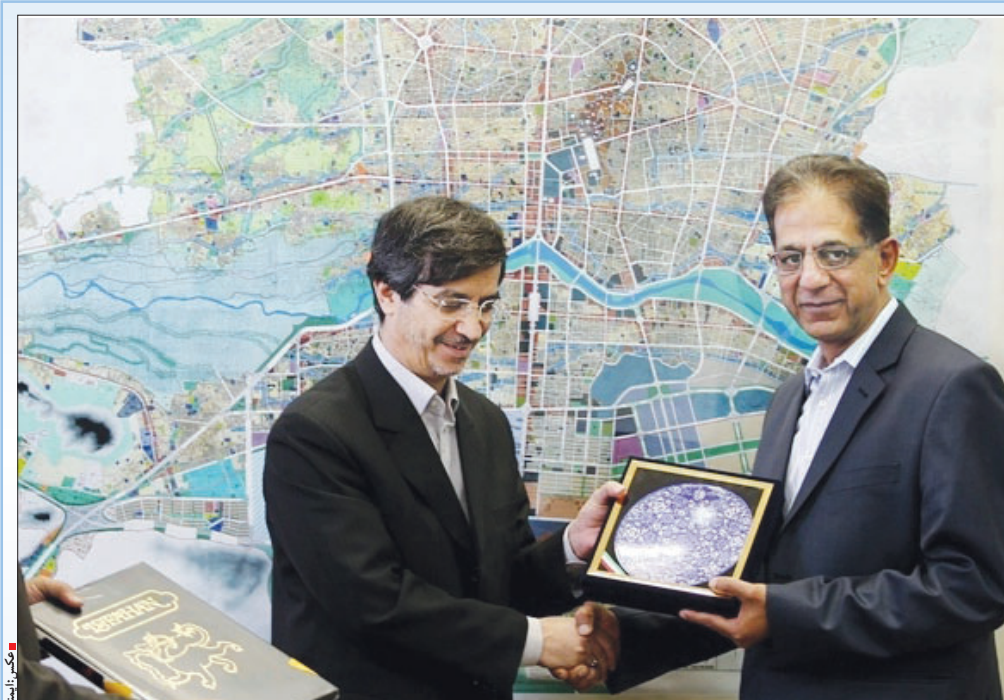
دکتر سقائیان نژاد در دیدار سفیر آفریقای جنوبی تاکید کرد: گسترش روابط اصفهان و آفریقای جنوبی با استفاده از ظرفیت‌های موجود

معاون وزیر صنایع و معادن در پاسخ انجمن‌های تولیدی استان اصفهان خبر داد: