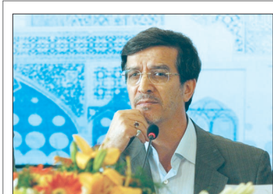
دکتر سقائیان نژاد شهردار اصفهان تاکید کرد:

اجرای آمارنامه شهر، بسیاری از مشکلات اصفهان را حل می کند