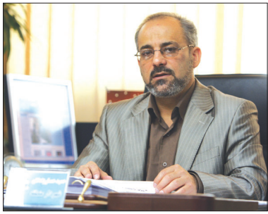
شهردار منطقه ۱۲ اصفهان خبر داد:

بهره‌برداری و آغاز عملیات ۳۰ طرح در منطقه محروم ۱۲ اصفهان