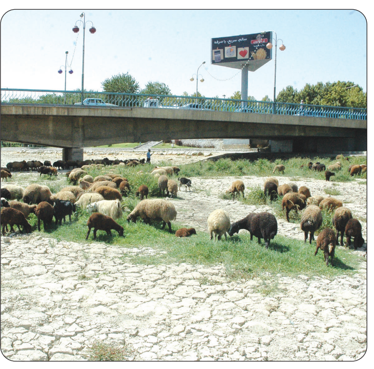
دیروز ساعت ۲ بهداز ظهر وقتی دوربین عکاس ما این صحنه را در خود ثبت کرد آنچه در ذهنش ماند چیزی جز تاسف نبود... زاینده رومدان آفتدر خشک شده که علف‌های هرز و چارپایان بر سینه‌اش سنگینی می‌کنند...