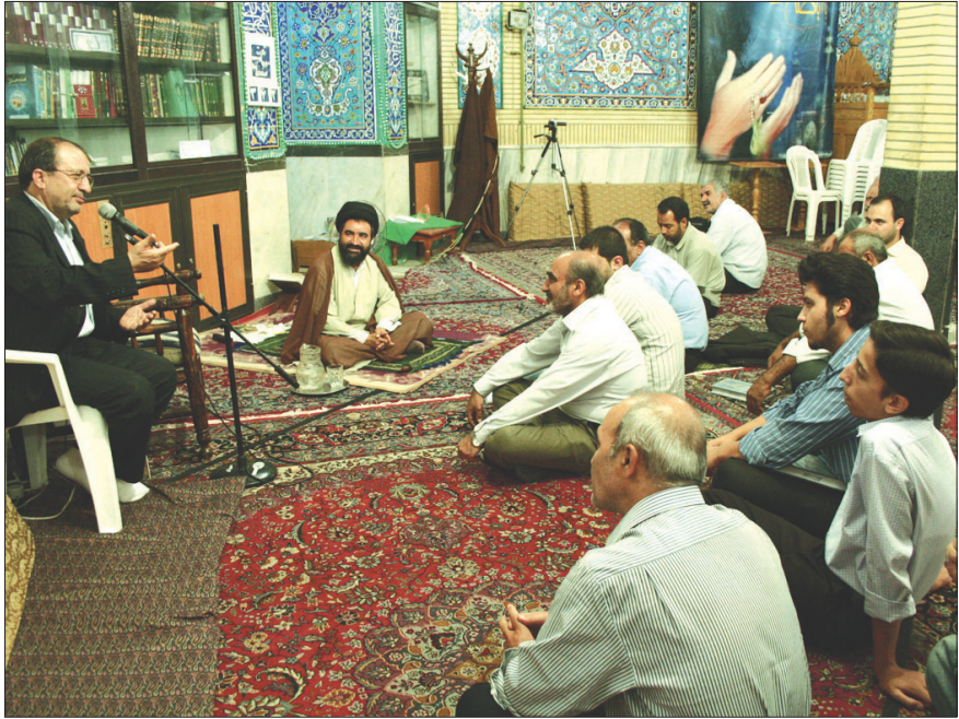
دیدار با مردم منطقه ۸ در مسجد امام علی (ع)

خیرگزاری فارس: رییس شورای اسلامی شهر ارومیه گفت: طرح پیاده‌رو سازی در ارومیه آغاز می‌شود. پرویز جلیلی در گفت‌وگو با خبرنگار فارس در ارومیه افزود: با مشخص شدن دو پیمانکار برای اجرای پیاده‌رو سازی سطح شهر و تخصیص ۱۰ میلیارد ریال اعتبار از سوی شهرداری مرکزی و ۱۰ میلیارد ریال اعتبار از سوی شهرداری‌های منطقه‌ای به زودی اجرای این کار به مرحله عمل درمی‌آید. وی خاطرنشان کرد: پروژه غیرهمسطح خیابان برق، بهشتی با ۹۵ درصد پیشرفت مواجه بوده است و طبق پیش‌بینی شهردار و پیمانکار تا اواخر مرداد ماه جاری به بهره‌برداری می‌رسد. جلیلی اضافه کرد: پل دانشکده در اوایل شهریور ماه سال جاری به بهره‌برداری می‌رسد و دیگر پروژه‌ها از جمله دو پل سیه چشمه در حال احداث هستند که تاکنون با ۲۵ درصد پیشرفت روبه‌رو بوده‌اند. رییس شورای اسلامی شهر ارومیه گفت: شورا در راستای خدمت به مردم از هیچ تلاشی فرو گذار نمی‌کند و اگر شهرداری موفق به انجام خدمات است در سایه همدلی تمام اعضا است.