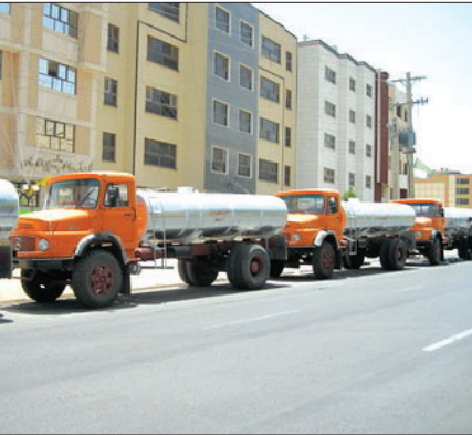
گروه خبر: رییس سازمان جهاد کشاورزی استان با اعلام این که

وی با بیان این که ساخت و ساز واحدهای فناوری در پارک علم و فناوری شیخ بهایی در حال انجام است افزود: تنها در سال گذشته، ۲۰هزار و ۱۲مترمربع از اراضی این پارک به ۱۸شرکت خصوصی دانش بنیان صاحب ایده های نو واگذار گردیده است.