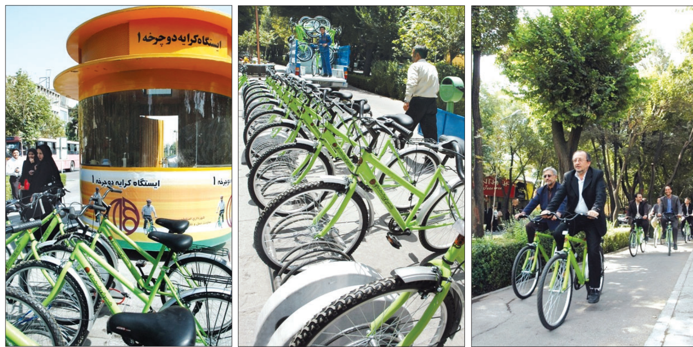
با حضور اعضای شورای اسلامی شهر اصفهان

طرح آزمایشی ایستگاه‌های دوچرخه کلید خورد