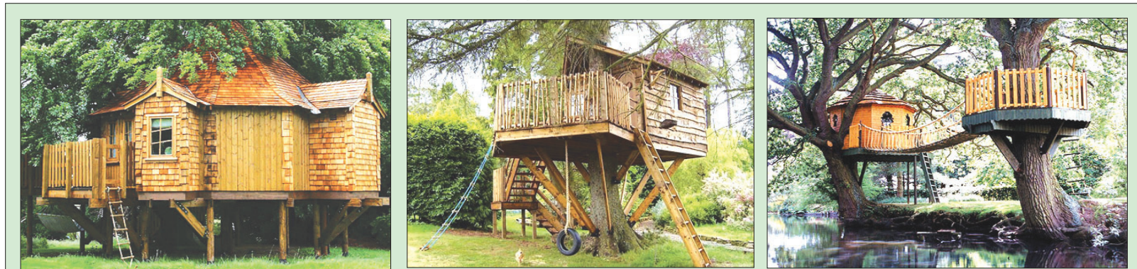
خانه درخت‌های زیبا و دیدنی در سراسر دنیا