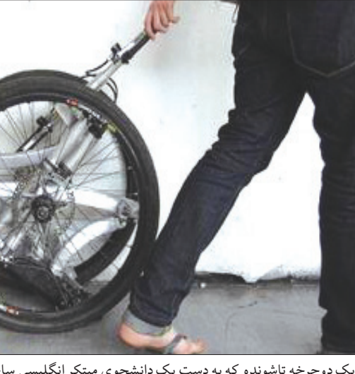
یک دوچرخه تاشونده که به دست یک دانشجوی مبتکر انگلیسی ساخته شده است