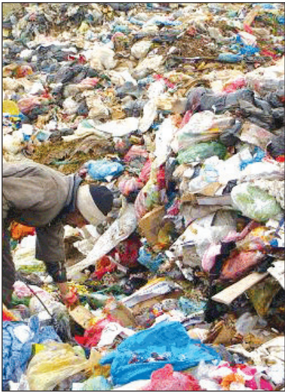
یک شهریک تکه

وی ادامه داد: اگر شهروندان رطوبت پسماندهای خود را برطرف نمایند، ۳۰٪ از هزینه‌های جمع‌آوری و حمل و نقل زباله در این کلان شهر کاهش می‌دهند.