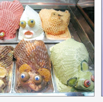
با بستنی هم میتوان مانند یک اشکال گوناگون درست کرد البته این هنریک فروشنده ایتالیایی است.