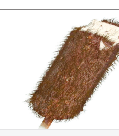
این هم یک نوع بستنی چوبی عجیب و غریب که در آفریقای جنوبی زیاد یافت می شود. دلتان می آید به این بستنی لب بزنید؟

طنین انداز است. نیمی از فیلم گذشته و هنوز چراغ های کنار سالن روشن است تا عده ای که تازه آمده اند به کمک مسوولان محترم در صندلی خود قرار گیرند و به خوردن میوه و شام و تنقلات مشغول شوند.