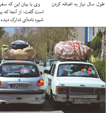
دو خودروی تاکسی در حال حمل بار مسافر در یکی از ایستگاه‌های مسافر در اصفهان.

وی با اشاره به وجود ۱۹۰ دفتر فروش بلیط علاوه بردفاتر مستقر شرکت‌ها در