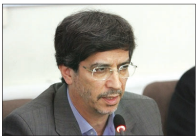
دکتر سقانیان نژاد، شهردار اصفهان: