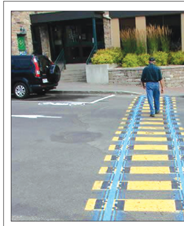
خط عبور عابرین پیاده به کمک هنر طراحی! و این چیزی است که به دلایل زیاد در شهر ما وجود ندارد یعنی باید از موقعیت خیابان حدس بزنی محل عبور است! حالا در این شرایط سخت این عکس‌ها را گذاشتیم تا ببینید چگونه و به چه زیبایی با استفاده از هنر این خطوط رسم شده است. خوش به حال عابرین...!!!