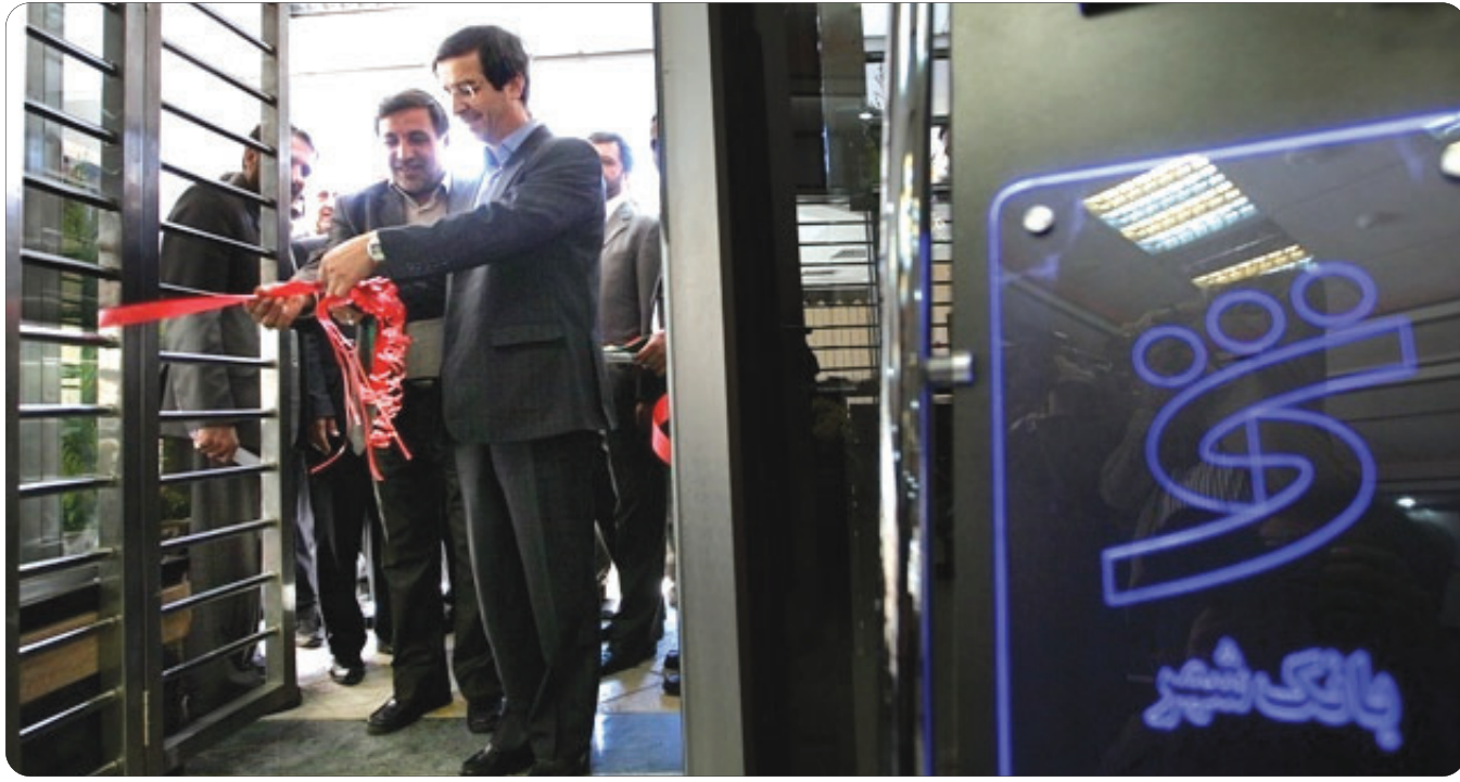
مسوول امور فرهنگی دفتر یونسکو در ایران:

نگرانی ها درباره برج جهان نما ناشی از اطلاعات غلط و سوء تفاهم بوده است