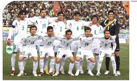
با پیروزی یک بر صفر ذوب آهن برابر شاهین: ذوب آهن در یک قدمی سپاهان