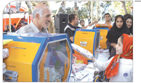
مدیرکل کمیته امداد امام خمینی (ره) استان خیر داد: برگزاری جشن احسان و نیکوکاری با یکصد پایگاه اصلی در اصفهان