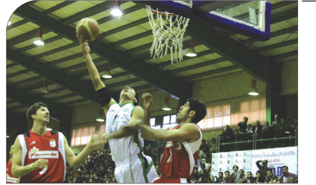
ذوب آهن ۷۳-۹۶ هنوز هیچ چیز تمام شده نیست