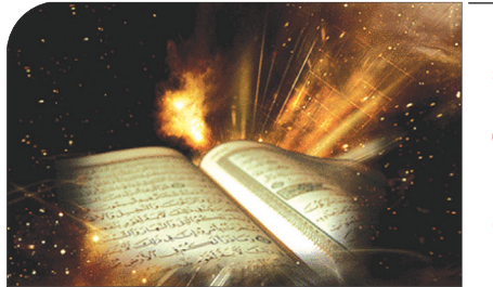
به همت موسسه مهد قرآن کریم و لایت استان برگزار می شود: سومین دوره آزمون های مفاهیم قرآن در اصفهان