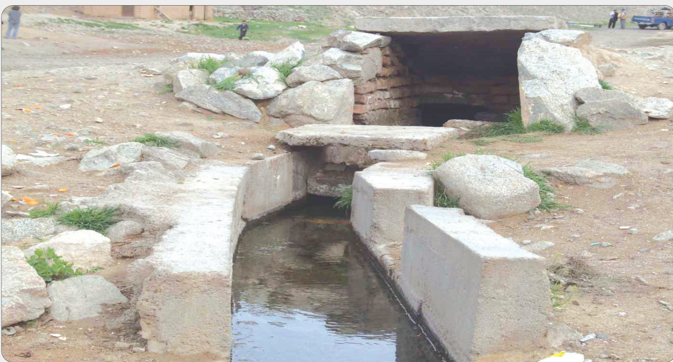
استمرار خشکسالی و پراکندگی نامناسب بارش‌های پاییزه موجب شده است:

کاهش شدید ذخیره سفره‌های آب زیر زمینی در اصفهان