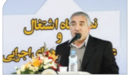
استاندار اصفهان در افتتاحیه سومین نمایشگاه اشتغال و عملکرد دستگاه های اجرایی استان:

دانشگاه های ما متناسب با نیازهای زمانه شکل نگرفته اند