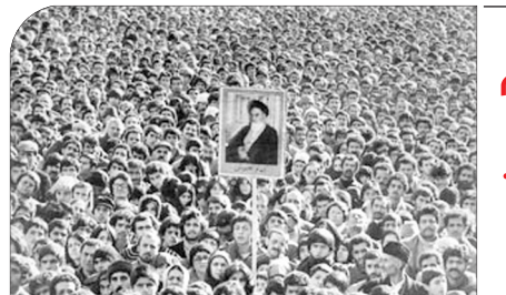
اصفهان در آینه کتاب

معرفی کتاب تاریخ سیاسی انقلاب اسلامی در اصفهان