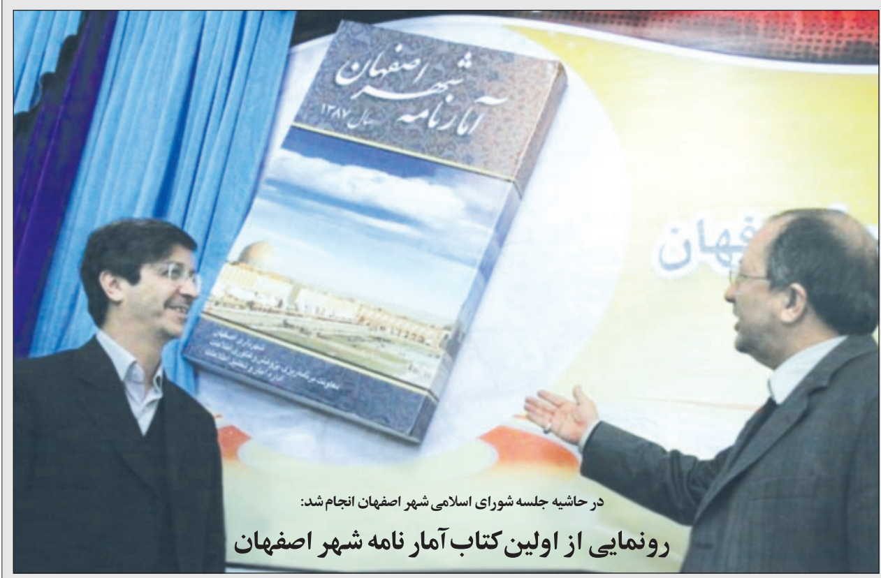
در حاشیه جلسه شورای اسلامی شهر اصفهان انجام شد:

رونمایی از اولین کتاب آمار نامه شهر اصفهان