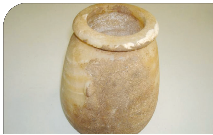
فرمانده انتظامی شهرستان اصفهان خبر داد: کشف کوزه سنگی متعلق به هزاره دوم قبل از میلاد