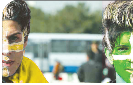
شهرآورد نصف جهان، داربی صدرنشینان اوج فوتبال باشگاهی ایران