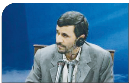
رئیس جمهور در نشستی مطبوعاتی با خبرنگاران داخلی و خارجی: هر اقدامی علیه ایران پاسخی پیشیمان‌کننده خواهد داشت