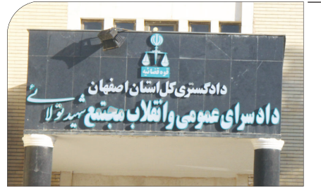
با حضور اقشار مختلف مردم قاتل معاون دادستان اصفهان به دار مجازات آویخته شد