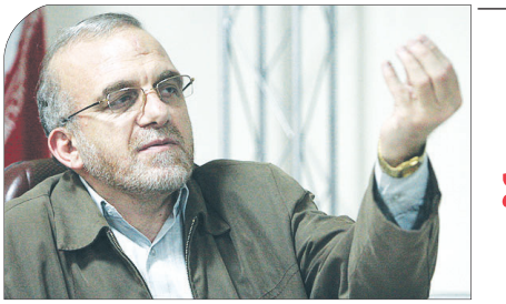
نماینده مردم اصفهان در مجلس شورای اسلامی: نمایندگان مجلس هم کارنامه دار می‌شوند