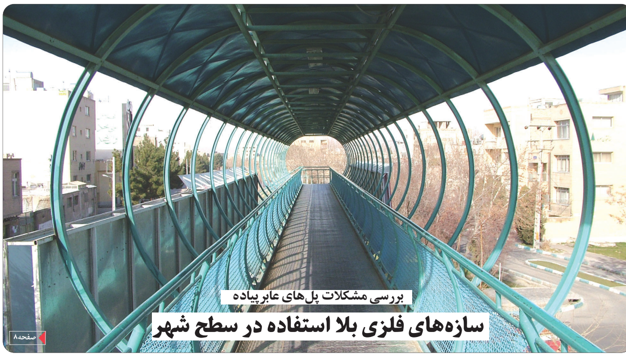
بررسی مشکلات پل های عابر پیاده

شهروندانی که تا پایان سال ۸۸ برای دریافت پروانه ساختمانی اقدام نمایند علاوه بر تخفیفات مصوب قبلی، ده درصد تخفیف در عوارض ارزش افزوده بر تراکم ساختمانی از سوی شهرداری اصفهان هدیه دریافت می نمایند