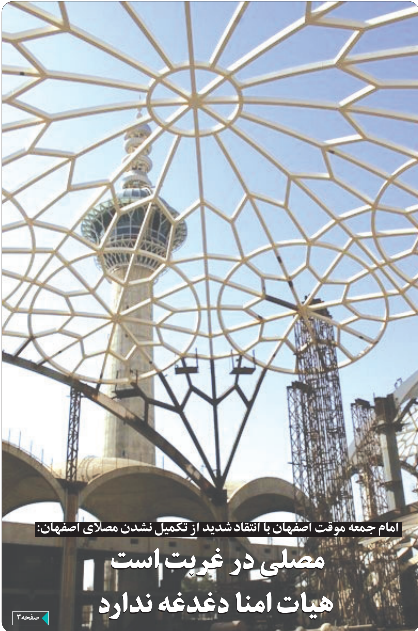
امام جمعه موقت اصفهان با انتقاد شدید از تکمیل نشدن مصلاي اصفهان: