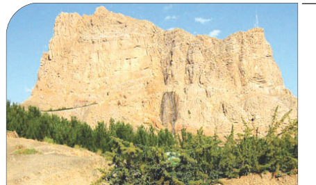
پارک کوهستانی صفا به روایت اصفهان زیبا: بام اصفهان پذیرای گردشگران داخلی و خارجی