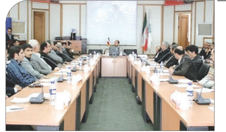
نگاهی به افتتاح مجتمع تجاری سازی فناوری در اصفهان ایده ها جامعه عمل می پوشند

بر اساس گزارش های ثبت شده از پنج گروه شهر ایستگاه سنجش آلودگی هوا در میدانی اصلی شهر، اصفهان از اول دی ماه امسال تاکنون تنها یک روز هوای پاک تجربه کرده سه روز هوای نسبتاً خوب و بیش از ۲۰ روز آلوده سپری کرده است. بر خلاف آب و هوای طبیعی دی ماه ارمغان هوای گرم و تابستانی روزهای اخیر در اصفهان هوای آلوده صبحگاهی است