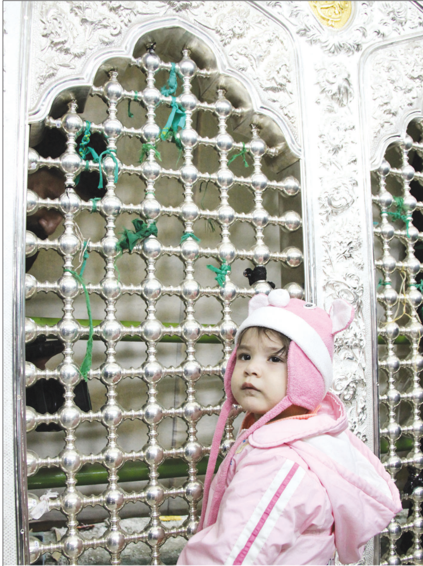
در مراسم رونمایی از پنجره های ضریح مطهر قتلگاه امام حسین (ع) در اصفهان عنوان شد: ۵۸ پروژه بزرگ در بازسازی عتبات عالیات اجرا می‌شود

با همکاری مردم و تلاش پلیس اصفهان: سارق خودروهای مدل بالا و جاعل اسناد دولتی دستگیر شد