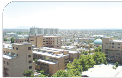
مدیرکل حوادث غیرمترقبه اصفهان: ۲۵ هزار واحد مسکونی در استان مقاوم سازی می شود