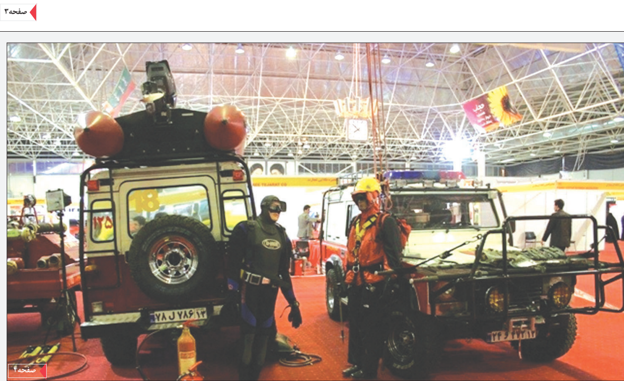
دومین نمایشگاه حفاظت، ایمنی، بیمه و آتش نشانی در اصفهان گشایش یافت

معاون وزیر نیرو در افتتاحیه چهارمین نمایشگاه صنعت آب و تاسیسات آبفا: