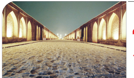
گزارشی از پل الله وردی خان و مرمت های انجام شده در آن شاهکار عهد صفویه بر بستر زنده رود