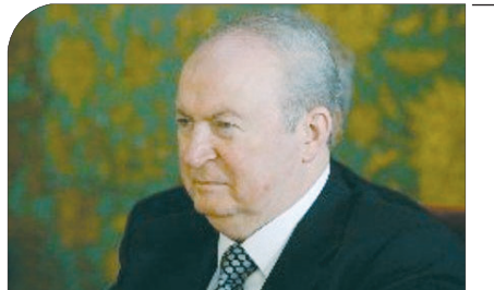
رییس مجلس سوریه در دیدار استاندار اصفهان: ایران الکوی ملت های مسلمان است