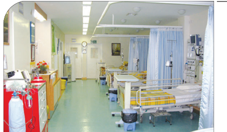
معاون وزیر مسکن و شهرسازی در کاشان خبر داد: بهره برداری از پنج بیمارستان در استان تا سه سال آینده