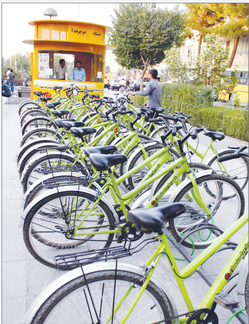
ایستگاه دوچرخه سواری به میدان امام و پل خواجه هم می رسد

علیرغم هزینه سنگین، احداث مسیر جایگزین برای بازگشایی ادامه حلقه سوم ترافیکی شهر در دستور کار مدیریت شهر اصفهان قرار دارد و در تدوین بودجه سال آینده شهرداری برای این امر تصمیم گیری لازم انجام خواهد شد