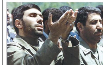
به مناسبت سالگرد شهادت امیر ارتش اسلام سپهبد علی صیاد شیرازی