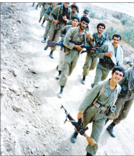
دشمن حرکت کردیم.

به یاد می‌آورم که در لحظات اولیه عملیات فرمانده‌مان آمد و گفت: «همان‌طور که می‌دانید عملیات مهمی در پیش رو داریم و باید تمام تلاشمان را بکنیم تا با موفقیت آن را به اتمام برسانیم.»