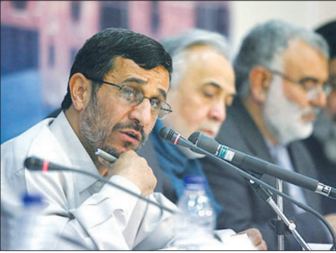
مردم رسیدگی قرار گرفت. بنابراین رضایت‌ها در این دوره بیشتر بوده است. این سفر هیج نتیجه‌ای برای مراکز دانشگاهی نداشت