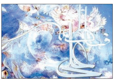
جشن پیوند آسمانی

حوریان بهشتی سوره‌های قرآن زمزمه می‌کردند و گویند ای از زیر عرض الهی صدزاده همه آگاه باشید امروز روز جشن پیوند علی و فاطمه است. همزمان با اول ذی‌الحجه سالروز پیوند آسمانی حضرت علی(ع) و حضرت فاطمه (س) فرهنگسرای خانواده اقدام به برگزاری جشن پیوند آسمانی در روز شنبه ۱۰ آذر ماه از ساعت ۱۵/۳۰ تا ۱۸ در محل فرهنگسرا واقع در خیابان جی-قطعات پروین جنب آتش نشانی می‌نماید. تلفن تماس: ۳۴۰۴۰۰۰