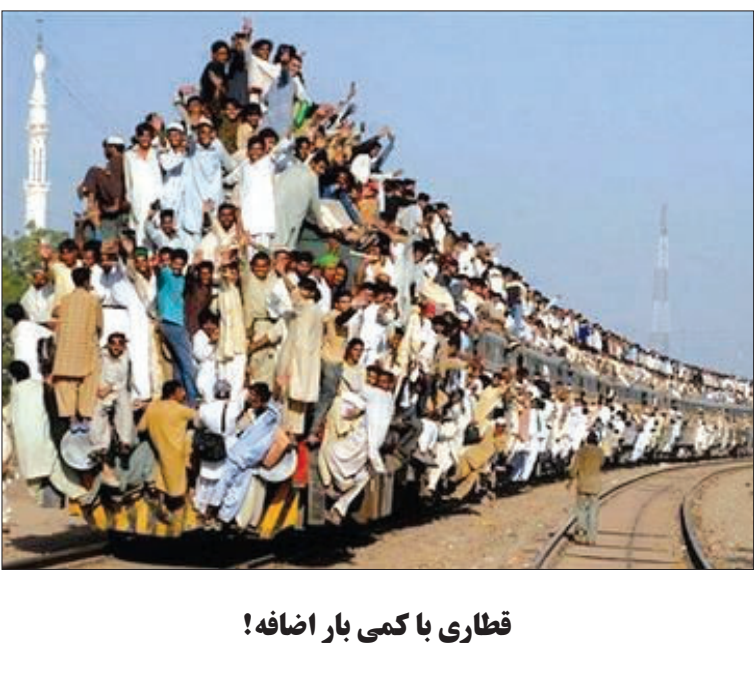
قطاری با کمی بار اضافه!