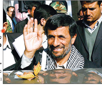
رئیس جمهور در جلسه هیات وزیران: