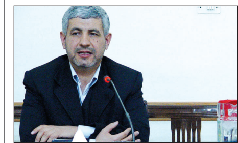
معاون خدمات شهری شهرداری اصفهان: