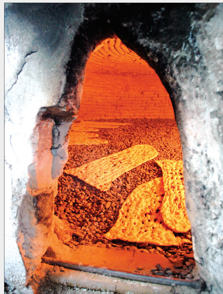
دبیر اتحادیه نانوایان کشور در هم اندیشی مسوولان نان استان‌ها اعلام کرد: