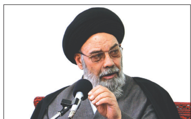
آیت الله طباطبایی: