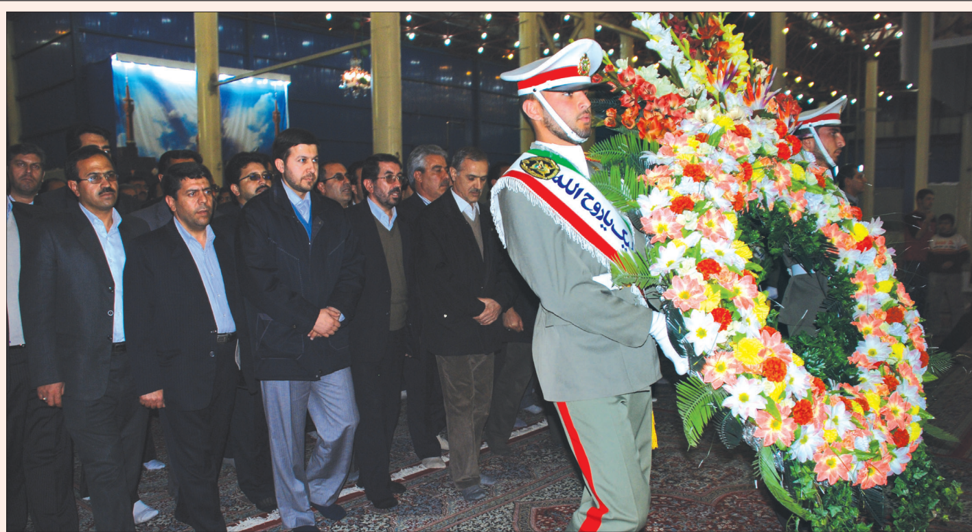
در آستانه سی امین سال پیروزی انقلاب اسلامی صورت گرفت: