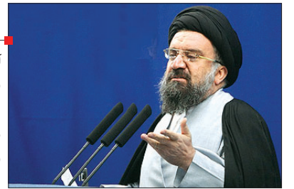
آیت الله خاتمی امام جمعه موقت تهران: