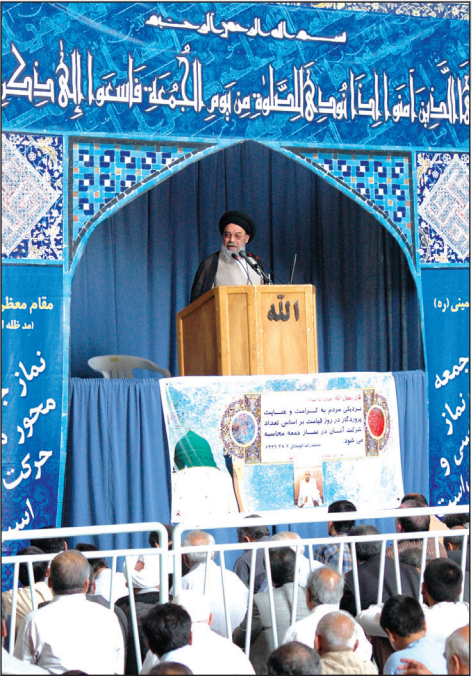
آیت الله طباطبایی امام جمعه اصفهان: