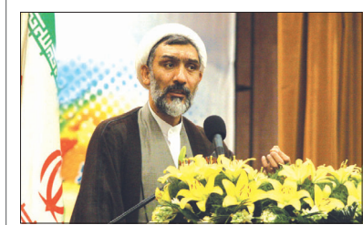
رییس سازمان بازرسی کل کشور خبر داد: