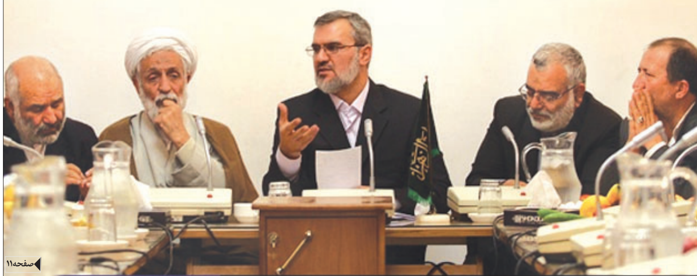
رییس کل دادگستری استان اصفهان: