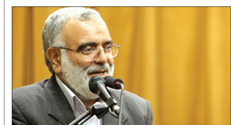
استاندار اصفهان در همایش مبارزه با قاچاق کالا تاکید کرد: