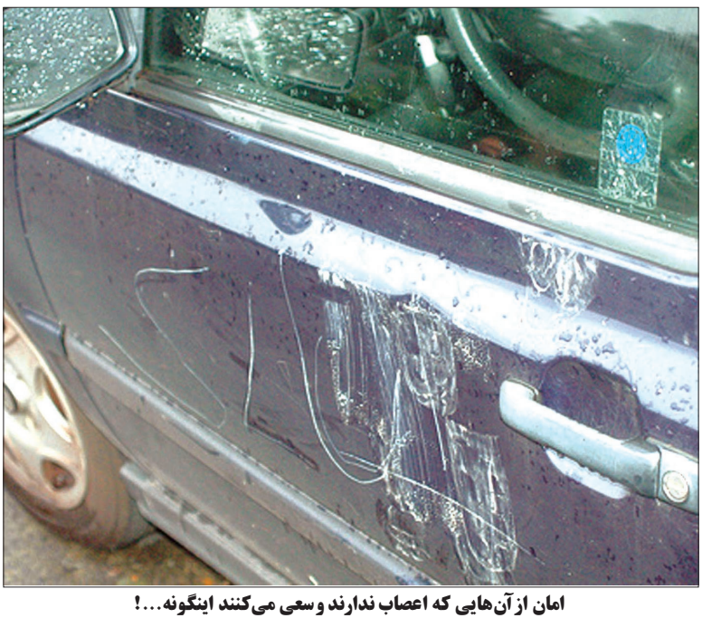
امان از آن‌هایی که اعصاب ندارند و سعی می‌کنند اینگونه...!