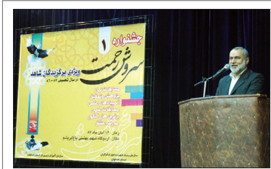
در جشنواره سروش رحمت انجام شد