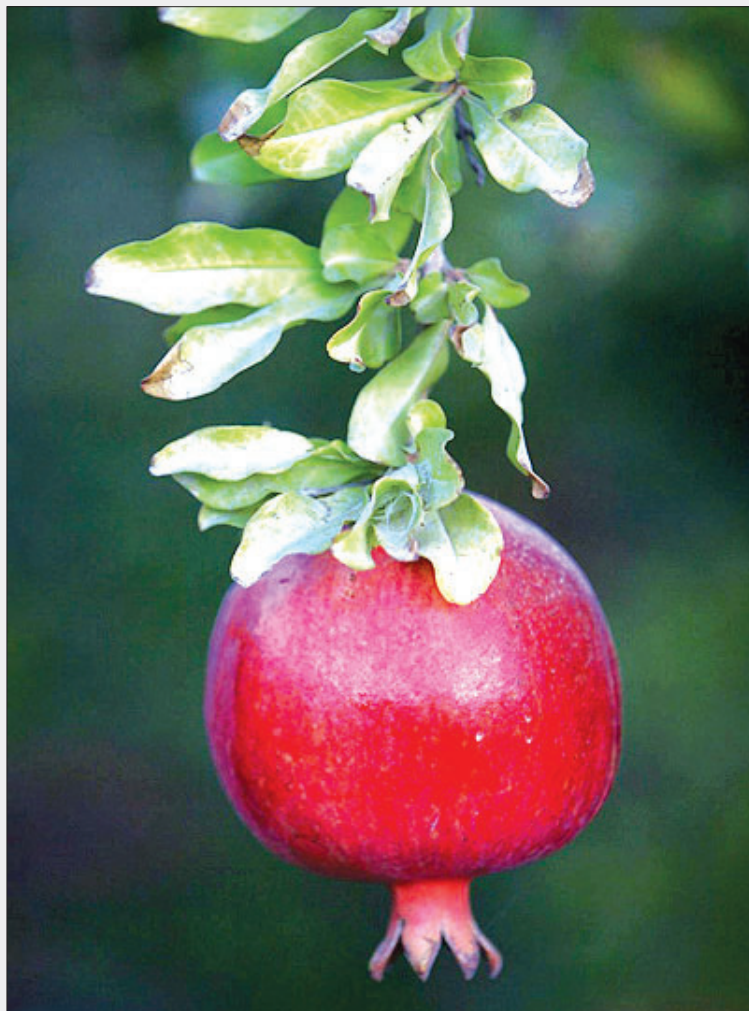
با نابودی ۱۰۰ درصدی باغ‌های انارکاشان