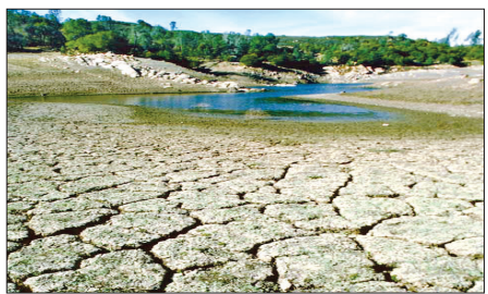
مدیر امور آب روستایی اصفهان:

گروه فرهنگ و هنر: جای خالی مخاطب‌شناسی در آموزش و پرورش امروز ما به نحوی بارز به چشم می‌خورد. در آموزش و پرورش متعالی، ویژگی‌های جسمانی، روانی، عاطفی و اجتماعی دانش‌آموزان در هر یک از سطوح و مقاطع تحصیلی سنجیده می‌شود و بر اساس نتیجه‌ی این سنجش به هر یک از افراد، برنامه‌ی خاصی ارائه می‌گردد. اصلاح نظام آموزش و پرورش باید پس از بررسی‌ها و مطالعات جامع و انجام چندین طرح آزمایشی در مناطق مختلف کشور انجام شود.