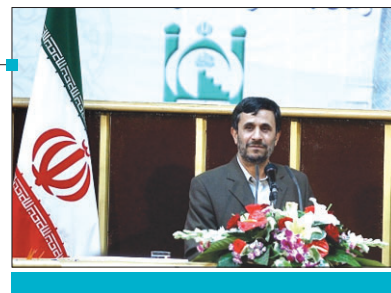
شهردار منطقه پنج در جمع خبرنگاران اعلام کرد:

رییس جمهور مساجد و نماز جمعه را پایگاه اصلی سازماندهی سیاسی و اجتماعی در اسلام دانست و تصریح کرد: نظام و جامعه اسلامی با الگوی تحزب غربی به پیش نمی‌رود و هیچ تشکل و سازمانی کارایی مساجد را ندارد. به گزارش اصفهان زیبا به نقل از پایگاه اطلاع رسانی ریاست جمهوری، دکتر محمود احمدی نژاد پیش از ظهر دوازدهم (چهارشنبه) در ششمین همایش گرامیداشت هفته جهانی مساجد با بیان این که مساجد مردمی ترین و مترقی ترین کانون سازماندهی در دنیا است، اظهار داشت: زیباتر، مردمی تر، پایدارتر و ریشه‌دارتر از این نوع سازماندهی در طول تاریخ نه تعریف و نه ایجاد شده است.