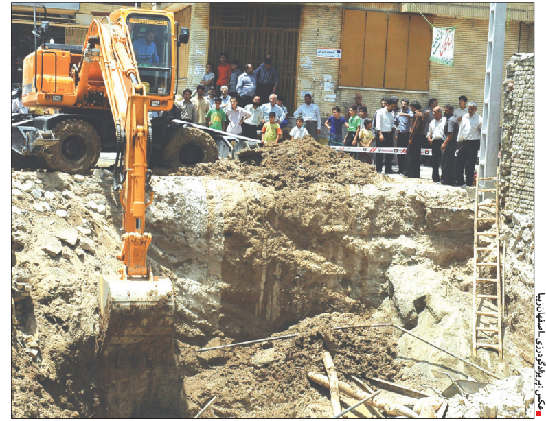
گودبرداری در سطح شهر اصفهان