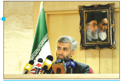
دبیر شورای عالی امنیت ملی هنگام ورود به فرودگاه بین‌المللی امام خمینی در جمع خبرنگاران: اجلاس ژنو مثبت و سازنده بود

دبیر شورای عالی امنیت ملی ایران فضای اجلاس ژنو و مذاکرات را سازنده و روبه جلو توصیف کرد و گفت: اجلاس ژنو به این منظور برگزار شد که درباره چگونگی مذاکرات، ساختار، ادامه و زمان بندی آن با یکدیگر به توافق برسیم. به گزارش اصفهان زیبا به نقل از واحد مرکزی خبر: جلیلی بامداد دیروز - دوشنبه - در بازگشت از ژنو، هنگام ورود به فرودگاه بین‌المللی امام خمینی (ره) در جمع خبرنگاران افزود: در این اجلاس با ابتکار عمل وارد شدیم که در برابر پیشنهاد آنها و نان پیبری (نقشه راه) که ارائه کرده بودند، پیشنهاد مشخص برای ادامه کار با رویکردی سازنده ارائه کردیم که مورد توجه و استقبال طرف مقابل واقع شد.