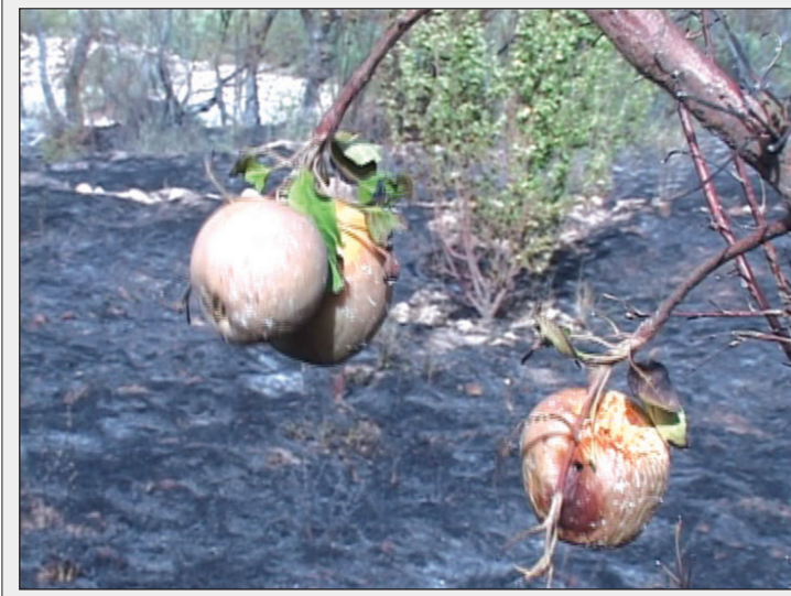
۲۵۰ هکتار از باغ‌ها، مراتع و جنگل‌های سمیرم در آتش سوخت