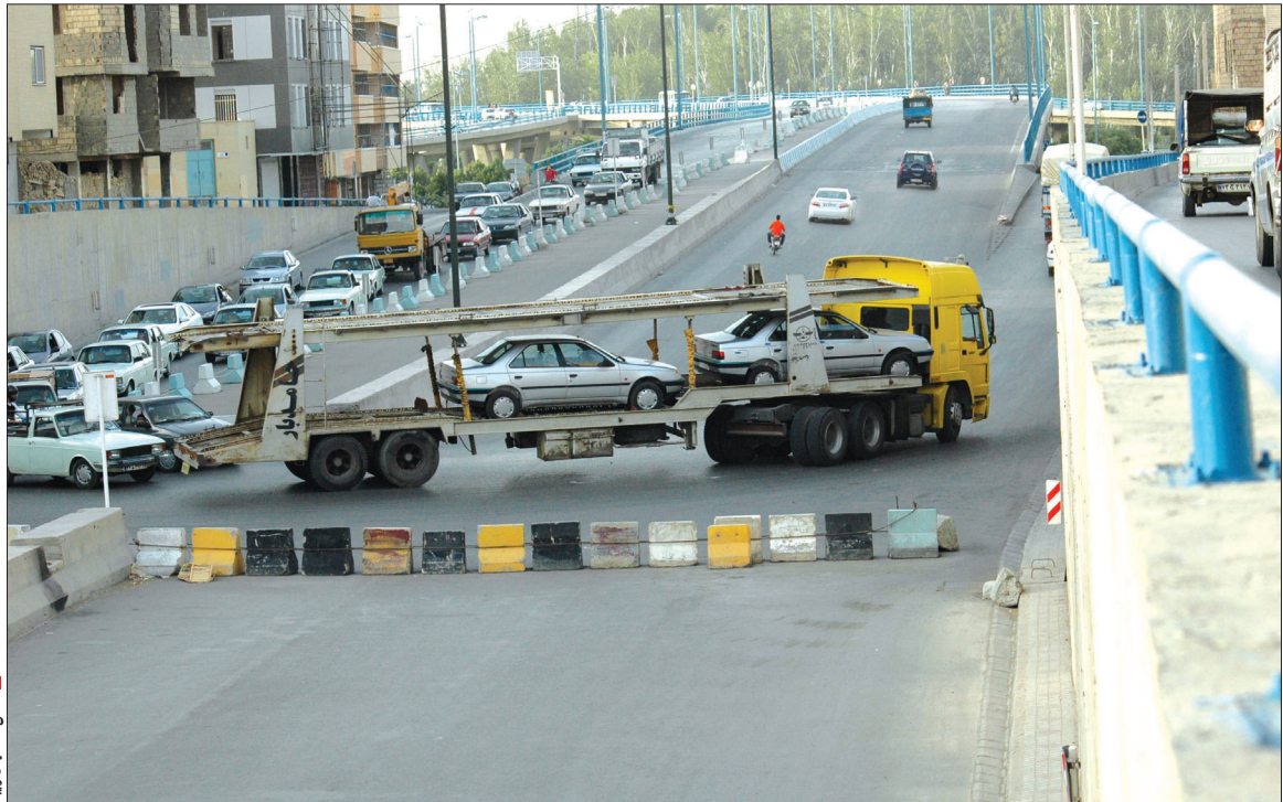
کمیته اصفهان زبا