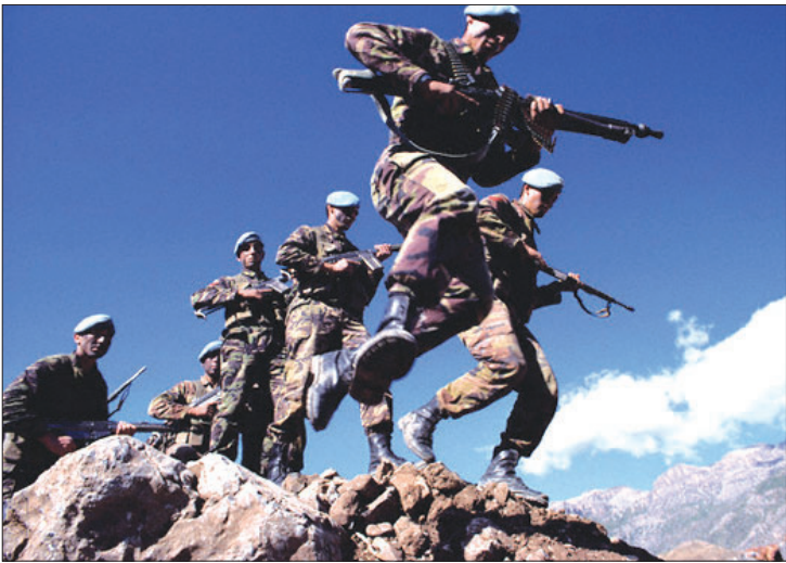
بررسی مختصری نماییم.

دربیی موضوع نیروهای ترکی: در میان نیروهای ترک ارتش این کشور به طور سنتی طرفدار اتخاذ سیاست شمت آهنین در برابر پ.ک.ک و کردها است و ژنرال بیوکلیت فرمانده ارتش از موافقان حمله به شمال عراق است؛ این رویکرد تقریباً موضع رسمی دولت ترکیه نیز می‌باشد، چه اینکه ارتش و دولت اقدام به دفع نیروهای کرد را نوعی تأمین امنیت داخلی ترکیه تلقی می‌نمایند. این موضع با موضع پارلمان این کشور نیز سازگاری دارد. چنانچه در ماه‌های گذشته شاهد بودیم که مجلس ترکیه پیشنهاد دولت برای صدور مجوز حمله به خاک عراق برای مقابله با پ.ک.ک را تصویب کرد. با توجه به جو حاکم بر پارلمان و کابینه، همسویی دولت ترکیه و پارلمان در این قضیه قطعی بود.