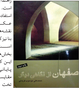
اصفهان از نگاهی دیگر

این احتمال را هم باید داد که کرمان مرکب از دو کلمه‌ی کار و مان می‌باشد. کلمه‌ی کار، معنی رزم و نبرد را دارد و کلمه‌ی مان، هم به معنای جایگاه و محل می‌باشد پس در نتیجه کرمان به معنای جایگاه محل دلبران و رزم‌آوران است. و اما در مرد بنای آن، عده‌ای نوشته‌اند که کرمان را اردشیر بابکان موسس سلسله‌ی ساسانی بنا کرده است و به نام وی به وه اردشیر معروف شد، عرب‌ها وه اردشیر را بردسیر گفتند ایرانیان آن را گواشیر نامیدند. این شهر از قبل از اسلام و حتی تا قرن چهارم مرکز ایالت کرمان بود. اما پس از آن چاپ و منتشر شده است.