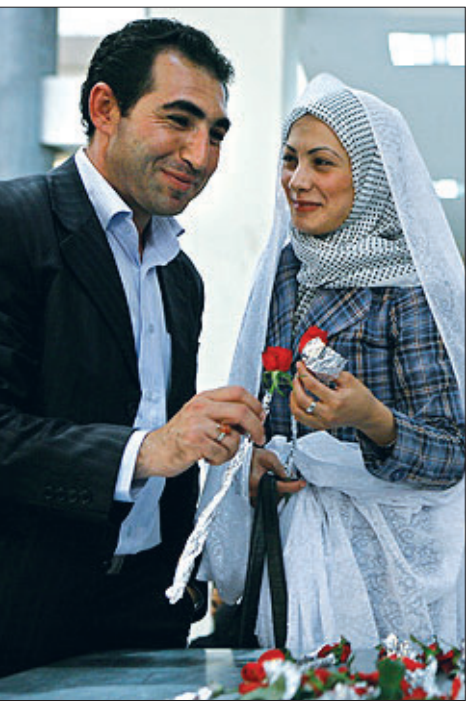
برخلاف برخی گمانه‌زنی‌ها درباره دختران دم بخت