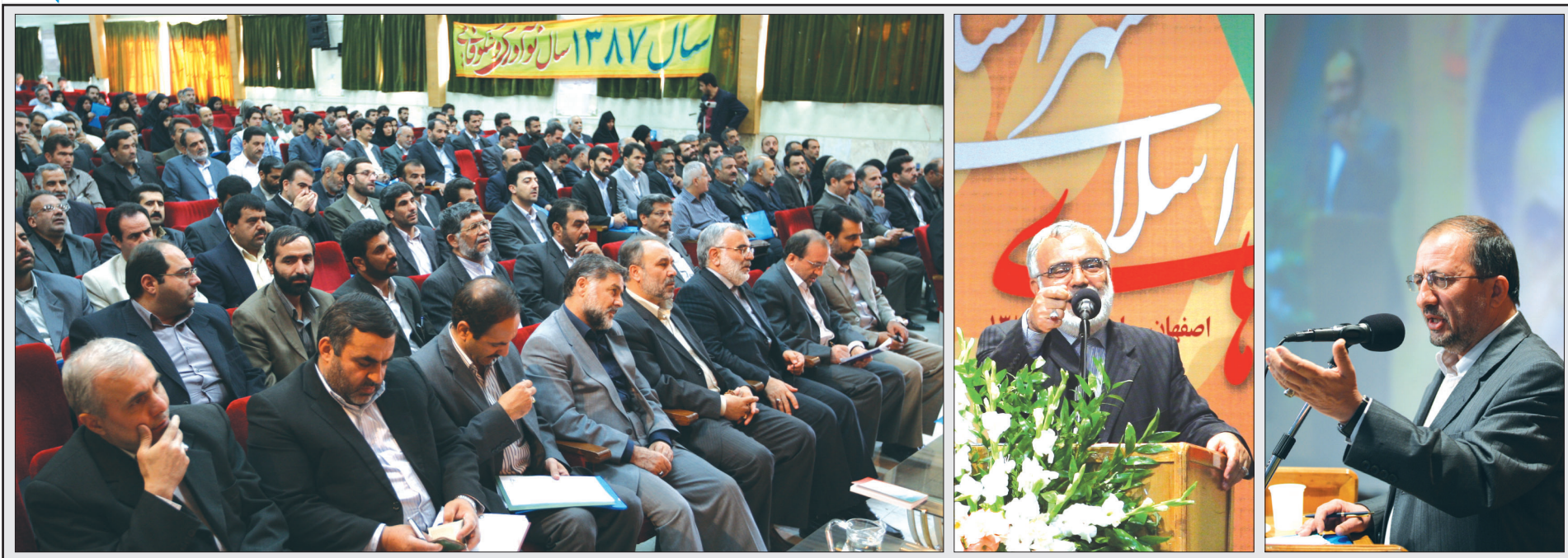
شهردار اصفهان در ملاقات‌های مردمی اهالی منطقه ۲ اعلام کرد:

نایب رئیس شورای عالی استان‌ها: سعی داریم در مجلس هشتم کمیسیونی ویژه ی شورا تشکیل داده و هر مصوبه‌ای که در رابطه با شورای عالی شهرسازی از شهرهای مختلف ارسال می‌شود را با حضور شهردار و رئیس شورای شهر به مشورت بگذاریم.