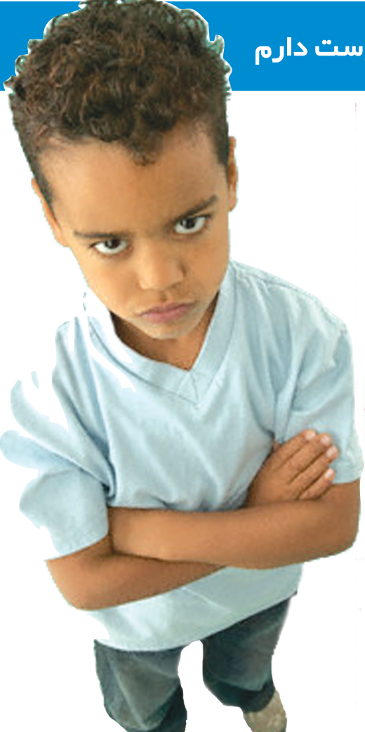
عکس زینبی است