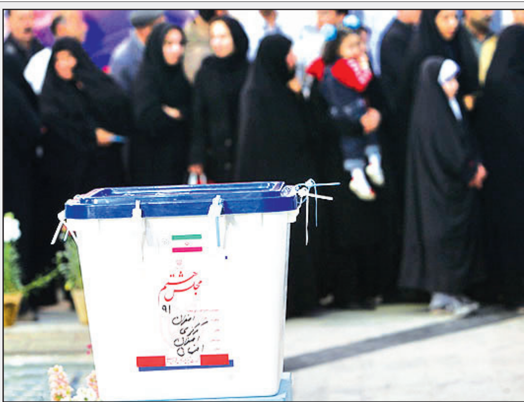
در شهرستان های اصفهان، مبارکه و نجف آباد صورت می گیرد