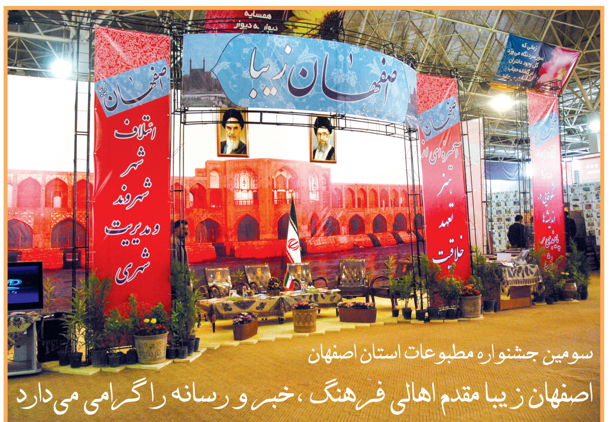
سومین جشنواره مطبوعات استان اصفهان

اصفهان زیبا مقدم اهالی فرهنگ، خبر و رسانه را گرامی می دارد